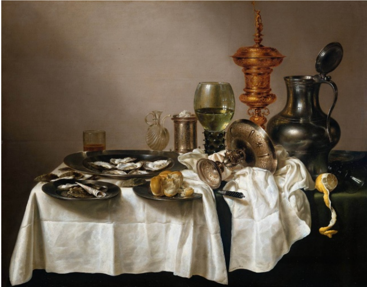
Willem Claeszoon Heda, Still life with oysters, a rummer, a lemon and a silver bowl, 1634, Amsterdam, Rijksmuseum