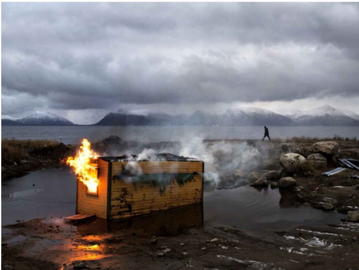
Jonas Bendiksen, Vesteraalen, Norway, 2012

Non solo. La questione del digitale investe anche la modalità d'archiviazione futura. Oltre ai problemi che sorgono dall'obsolescenza digitale c'è un altro rischio, ovvero la mancanza di sedimentazione delle informazioni. La stratificazione è meno percepibile, manca spesso di prospettiva, di distanza temporale e spaziale. In futuro ci saranno dei nuovi Orlando che raccoglieranno il desueto digitale? Il confronto con l'archivistica classica è essenziale a tal proposito, ecco perché iniziative come il progetto DATA – Sharing Archives ( http://www.data-sharingarchives.it/ ), che sta vedendo la luce proprio in questi mesi, sono da seguire. Si tratta di un progetto finalizzato alla valorizzazione del patrimonio archivistico italiano e al recupero e circolazione online di fonti d'archivio desuete , come si può dedurre dai link pubblicati sulla loro pagina facebook. ( https://www.facebook.com/pages/DATA-Sharing-Archives/243645949159648?ref=ts&fref=ts )