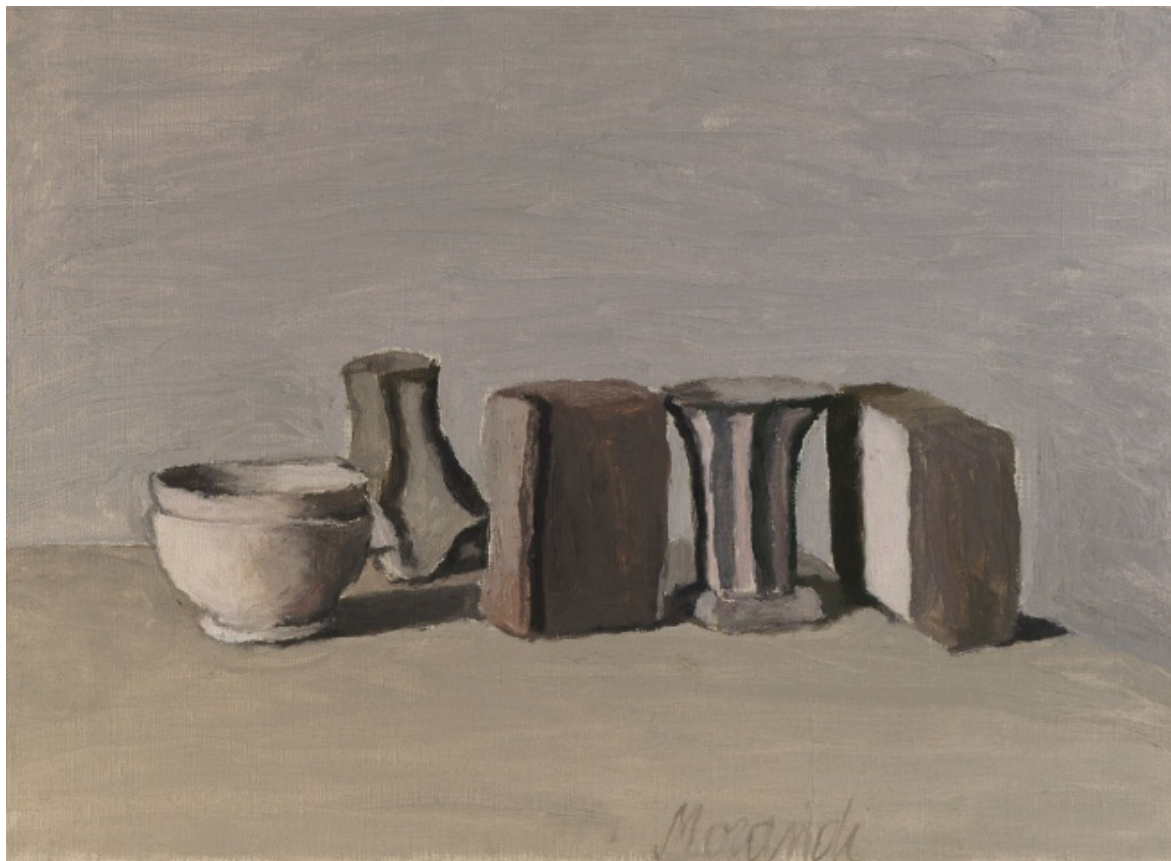
Giorgio Morandi, Natura morta , 1951, Bologna, Museo Morandi