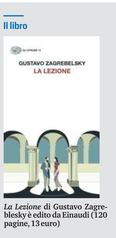
La Lezione di Gustavo Zagrebelsky è edito da Einaudi (120 pagine, 13 euro)

«Devi avere in testa l'oggetto della tua spiegazione e poi, per tutto il tempo, girarci intorno. Ma non da solo. Chi ascolta deve compiere con