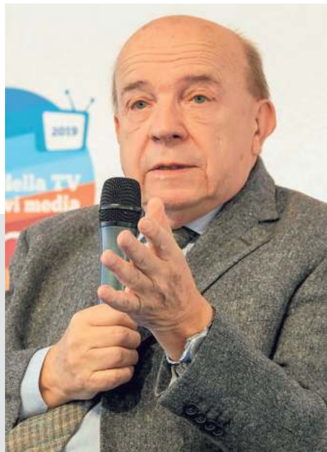
Giurista, Gustavo Zagrebelsky è stato giudice costituzionale dal 1995 al 2004 e presidente della Corte costituzionale nel 2004. E' professore emerito della Facoltà di Giurisprudenza dell'Università degli Studi di Torino dal 2009

bisognerebbe fare è chiedere: qual è il problema? Dillo anche a noi. Perché la lezione è di tutti e, tantomeno, di “uno contro tutti”».